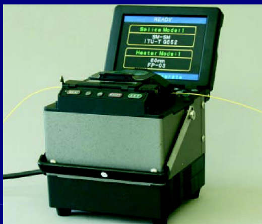
Верхнее расположение экрана